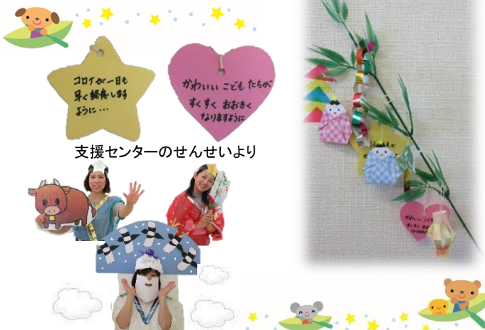
支援センターのせんせいより