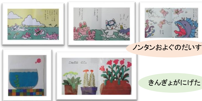
ナンタンおよぐのだいすき