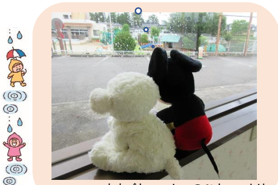
ままごとコーナーのひとコマより